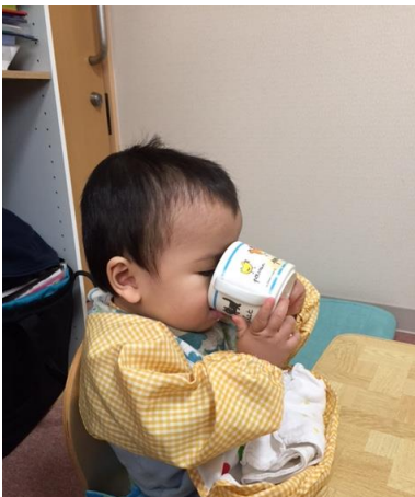
コップでごくごく…「ぷはーっ」