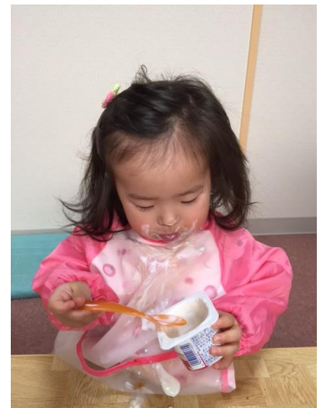
だいすきなヨーグルト♪♪